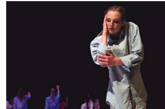
Aus: The Nimble Project

Genau deswegen haben wir diesen Titel gewählt. Wir sind der festen Überzeugung, dass genau diese Wendigkeit