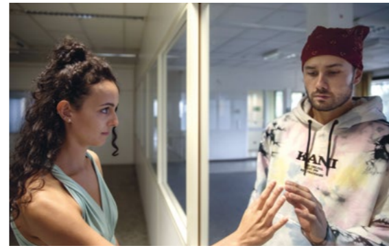
Aus: „fear.less“ von Johanna Richter

„fear.less“ – also angstfrei oder weniger Angst haben – ist der Titel Deines Stückes, hast Du das Gefühl wir bewegen uns auf eine Gesellschaft der Angst zu?